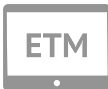
ESTACIÓN DE TRABAJO MÉDICA