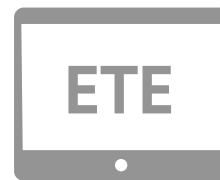
ESTACIÓN DE TRABAJO ENFERMERIA